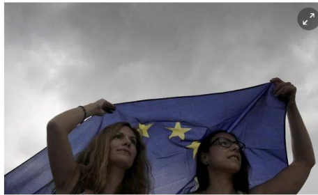
Greek protesters during a pro-euro rally in Syntagma square, Athens.

After three emergency bailouts and the biggest debt restructuring in history, talk has again turned to the country dropping out of the currency union