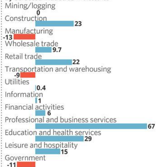
By selected industries In thousands