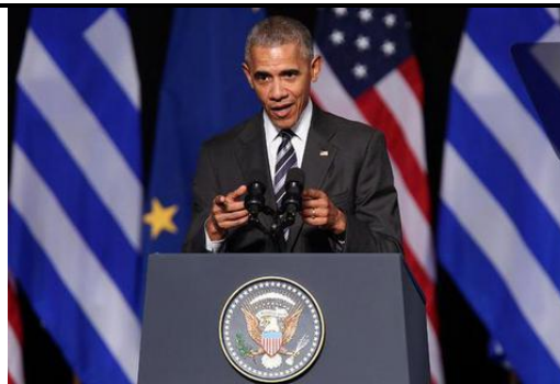
Bild: Ο Ομπάμα πίεζε υπερβολικά τη Μέρκελ για διάσωση της Ελλάδας

Πέρσι, αντίστοιχη απόφαση του Moody's για την υποβάθμιση της Τουρκίας είχε προκαλέσει την έντονη αντίδραση του Ταγίπ Ερντογάν.